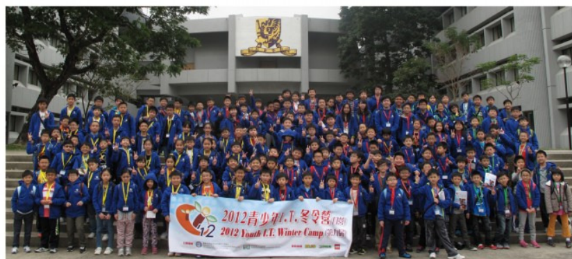
▼ 青少年I.T.冬令營大合照