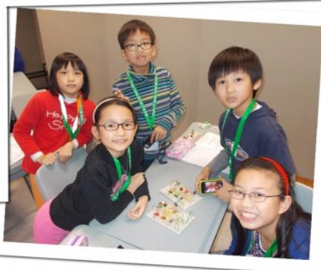
▲ 青少年I.T.冬令營活動花絮