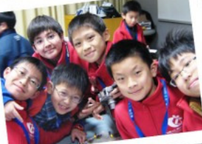
▲青少年I.T.冬令營花絮