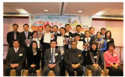
▲「兩文三語菁英大比拼」得獎同學

第八屆全港中學「兩文三語菁英大比拼」決賽已於上月17日在香港浸會大學順利完成，頒獎禮亦於1月14日假香港華商會所完滿舉行。今屆賽事吸引全港逾百間中學近560名學生參加，分初級組(中一至中三)及高級組(中四至中七)進行，評判綜合初賽、複賽及決賽的表現選出優勝者。